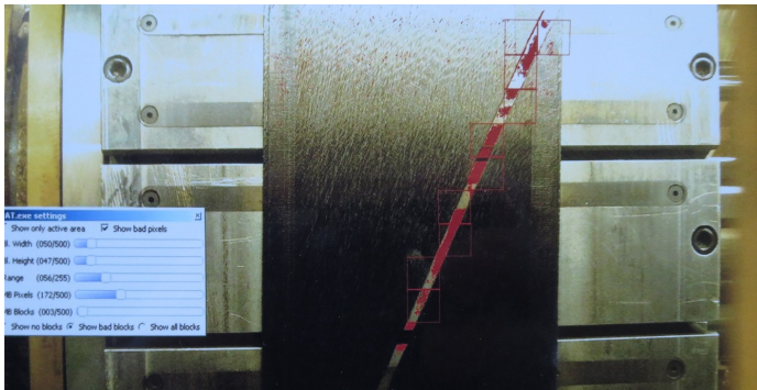
Bildanalyse-Tool im Lernmodus...